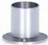
Подов фланец за колона ф-40