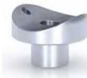
Сглобка, ръкохватка ф-50 към колона ф-40