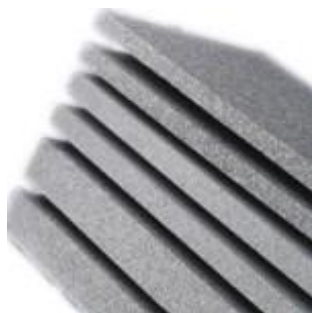
Топлоизолация - графитна

Уникалността на NEOPOR® е очевидна. Материалът е представен в изискан графитно сив цвят, разкриващ голямата тайна.