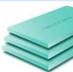
Топлоизолация с фибран

XPS се получава от пяна на същия полимер, но при различна технология на оформяне на микропорите, която ги прави по-малки и, най-важното, със затворена структура. Така се постига абсолютна водо- и паронепропускливост, както и по-висока якост при същата плътност. Заедно с повишената устойчивост на стареене, това са и предимствата на екструдирания пенополистирол пред експандирания, но при сравнително по-висока себестойност на материала. Макар и с много по-висока якост от минералната вата,